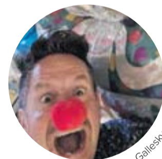
EL MUNDO, Jens Galleksky, Foto: Frau Schützel

„EL MUNDO BALLONWELT hat den täglichen Anspruch, unseren Kunden ein Lächeln zu schenken und auf die Entdeckungsreise der gigantischen Auswahl an Ballonen, Grußkarten und personalisierten Geschenken mitzunehmen. Phantasie, Farbe, Kreativität und Freude verzaubern uns – gute Laune garantiert. Immer neu, immer anders, täglich bis 20 Uhr.“